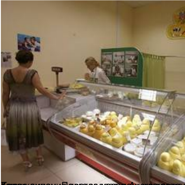
Клиентка дегустирует сыры в фирменном магазине в Вероне. В